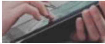
Рис. 1. – Баннер «Обучение по санитарно-просветительским программам - основы здорового питания»

Для процедуры регистрации необходимо нажать кнопку «Регистрация в ПС – обучение по программам основы здорового питания» (рис.2).